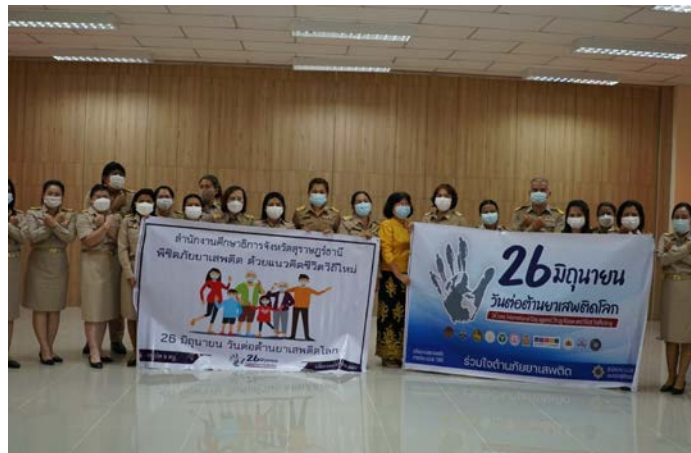
วันต่อต้านยาเสพติดโลก เมื่อวันที่ ๒๖ มิถุนายน ๒๕๖๔

๑๖. ภาพกิจกรรมที่เกิดขึ้นภายในโครงการ / กิจกรรม (ที่สื่อถึงการดำเนินการสู่ความสำเร็จ จำนวน ๕ ภาพ ขนาด file เท่ากับหรือมากกว่า ๒ MB)